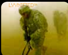
POLVO – LYYN le da una visión más clara.