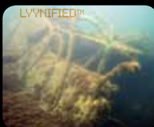
IMÁGENES SUBACUÁTICAS – LYYN le da una visión más clara.

LYYN AB Ideon Science Park SE-223 70 Lund, Sweden Phone: +46 46 286 57 90 info@lyyn.com www.lyyn.com