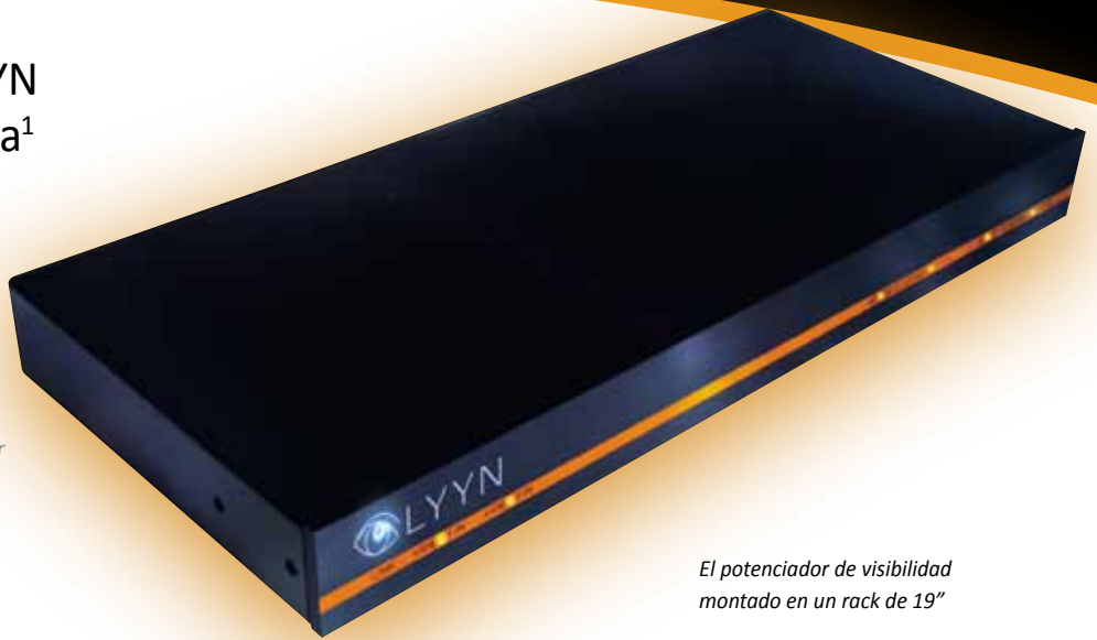
El potenciador de visibilidad montado en un rack de 19"

1 Lynnificar: Verbo transitivo. Potenciar, modificar una imagen video para aclararla y verla mejor.