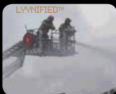
NIEVE HUMO – LYYN le da una visión más clara.