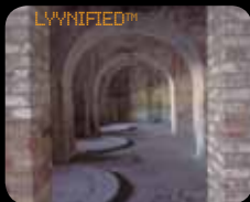
BAJA ILUMINACIÓN – LYYN le da una visión más clara.