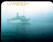
NIEBLA Y CALIMA – LYYN le da una visión más clara.