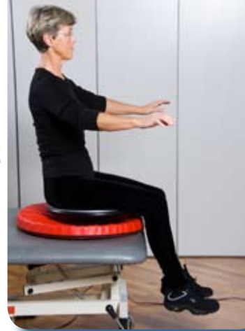
Entrenamiento en el Vibrosphere® mejora el control postural.