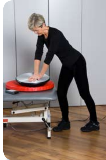
Contracciones pueden ser tratadas con vibraciones ya que facilita el estiramiento de las articulaciones.