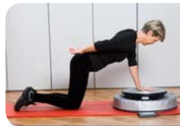
Entrenamiento de equilibrio y de vibración aumenta la fuerza y mejora el equilibrio.